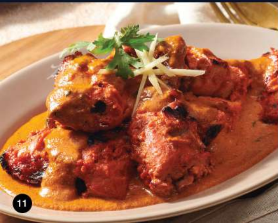
TANDOORI MURGH MASALA