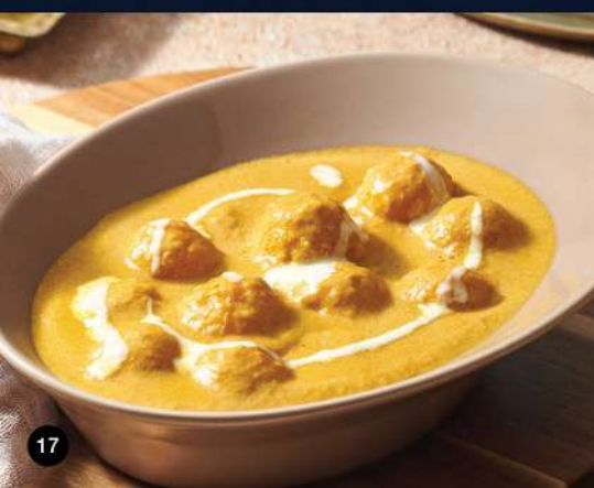
ANGOORI KOFTA KORMA