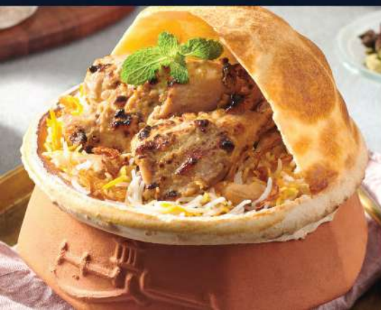
AFGHANI MURGH BIRYANI