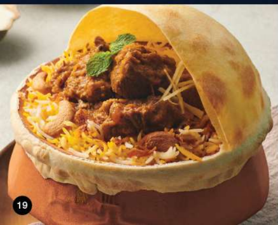
GOSHT NIZAMI BIRYANI