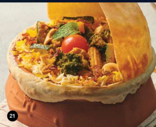
VILAYATI SUBZI BIRYANI